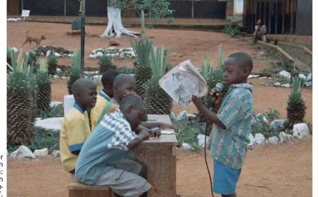
Grundschulkinder einer Partnerschule in Ngaoundéré, Kamerun: Die Jungen führen einen Sketch zum Thema Pflanzen- und Tierschutz auf.

Das ärgert mich nicht. Das gibt mir die Gelegenheit, diesen Menschen zu erklären, dass es in einer Nord-Süd-Schulpartnerschaft nicht unbedingt um finanzielle Hilfe geht. Wir leben in einer globalen Welt, wo die Wirtschaftsbeziehungen ineinander verflochten sind. Es ist wichtig, die Zusammenhänge in dieser einen Welt zu kennen, um eine gerechte, friedliche und nachhaltige Welt gestalten zu können. Dabei spielen interkulturelle Kompetenzen eine