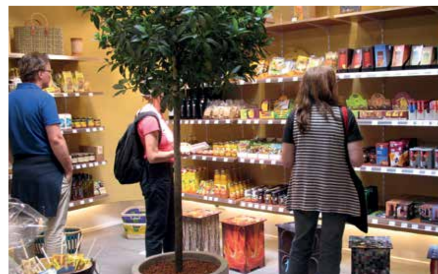
Einkaufsorte des Fairen Handels: Weltladen Ravensburg und Tauberbischofsheim (u.).