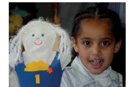
Kind mit Wichtelpuppe in Äthiopien.