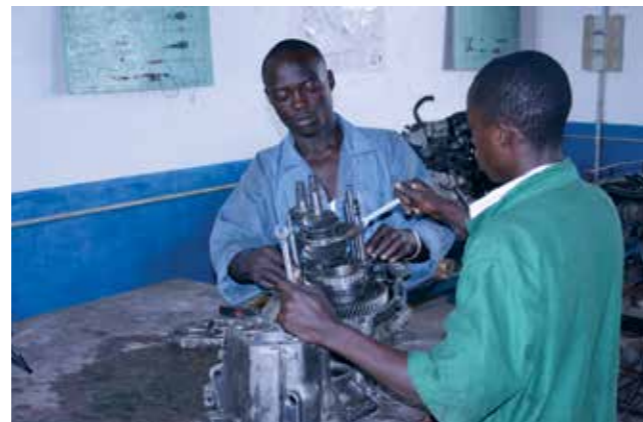
Auszubildende in einer Berufsbildungsstätte.

der Aktivitäten, der Betreuung der mit Landesmitteln geförderten Projekte sowie dem Ausbau der partnerschaftlichen Beziehungen beauftragt. Zur Umsetzung dieser Aufgaben dient seither das Kompetenzzentrum Burundi der SEZ. Solche Länderpartnerschaften bieten einen de-