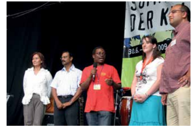
Forum der Kulturen: Dachverband der Migrantenvereine.