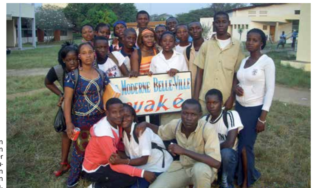
Fotos sausen per Mail von Land zu Land. Hier schickten Schülerinnen und Schüler eines Gymnasiums in Bouaké, Elfenbeinküste, einen Gruß an die Partnerschule in Reutlingen.

zentrale Rolle. Wer in der Zukunft diese Kompetenzen nicht hat, wird als „Analfabet“ gelten. Die Schulpartnerschaft bietet einen Rahmen, in dem das Globale Lernen stattfindet. Die Begegnung mit der fremden Kultur ist bereichernd, die Schüler lernen, Dinge aus der Perspektive des Anderen zu betrachten und über den Tellerrand zu schauen. Klar kann es vorkommen, dass der Partner des Nordens seinem Partner des Südens finanziell beisteht. Aber glauben Sie mir, die Partner des Südens freuen sich nicht immer über diese Situation. In Afrika weiß man ganz genau, dass eine Schulpartnerschaft auf gleicher Augenhöhe kaum möglich ist, wenn einer der Partner auf die finanzielle Unterstützung des anderen angewiesen ist. Zum Thema ▶