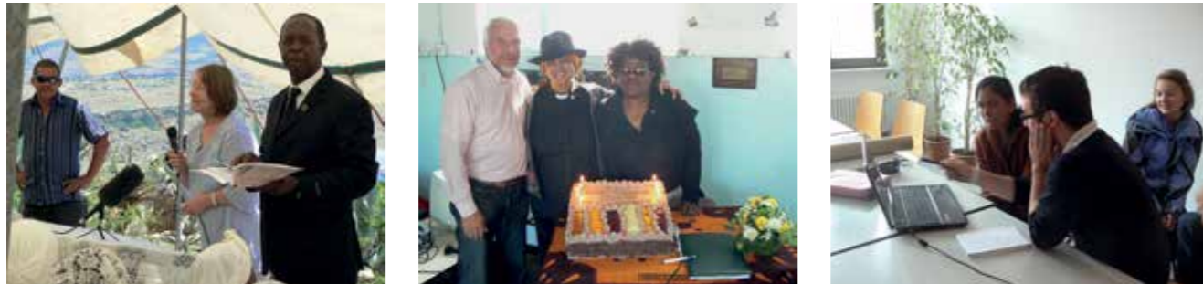
Mission und Partnerschaft: Die unterschiedlichen „Dialekte des Glaubens“ miteinander ins Gespräch bringen.