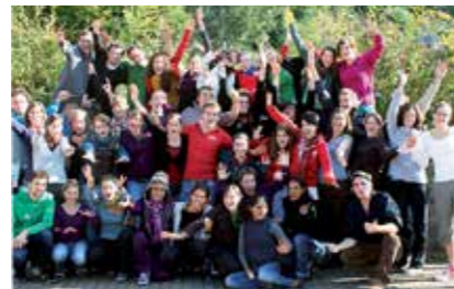
Freiwillige reisen nach Peru.

In Deutschland haben junge Menschen die Chance, an einem Freiwilligendienst im Ausland teilzunehmen und damit, durch öffentliche Gelder finanziell unterstützt, eine außergewöhnliche Lernerfahrung zu machen. Jungen Peruanerinnen und Peruanern fehlt diese Möglichkeit.