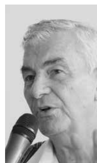
Nein zu Prostitution