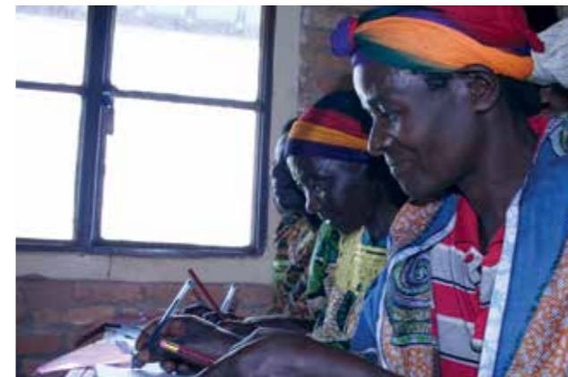
Frauen lernen Lesen und Schreiben.

Zur Person: Seit August 2012 bin ich als Referent für das Kompetenzzentrum Burundi der SEZ tätig. Ich bin Diplom-Geograph und qualifizierter Koordinator im In-