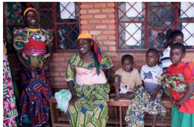
Patienten vor einem Krankenhaus in Burundi.

Seit vielen Jahren besteht eine Partnerschaft zwischen Burundi und Baden-Württemberg. Was kann sie leisten?