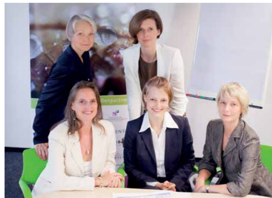
Die fünf Vorstandsmitglieder der Initiative "Geld mit Sinn".

Anlageprodukten schon gibt und ob ihr Wunsch nach einer nachhaltigen Geldanlage ernst genommen wird. Wir möchten auch herkömmliche Banken ermutigen, dass sie mehr nachhaltige Geldanlagen anbieten und da ist es auch wichtig, dass die Nachfrage für die Banken spürbar ist. Wenn die Bank sich nicht engagiert zeigt oder das Angebot zu klein oder nicht attraktiv ist, wäre der nächste Schritt, sich nach einer spezialisierten Bank oder Beratung