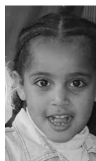
Wichteln ist schön!