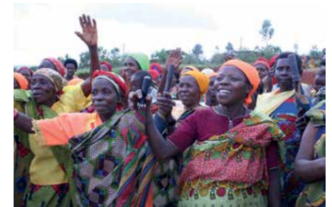
Eine freundliche Begrüßung in Burundi.

ativen, die Beratung und der Kontakt zu lokalen Gruppen und der interessierten Öffentlichkeit sowie der Aufbau und die Vertiefung von Netzwerken sein. Ziel ist es, neue Akteure für die Partnerschaftsarbeit zu gewinnen. Das soll auch im engen Austausch mit den anderen Fach- und Regionalpromotoren sowie anderen entwicklungspolitischen Akteuren geschehen. In der Vernetzung liegt ein großes Potential: Netzwerke bedeuten Austausch, Motivation, Synergieeffekte und damit eine größere Breitenwirkung. Das „Partnerschaftszentrum“ schließt nahtlos an die langjährige Arbeit der SEZ an: Die Stiftung berät, unterstützt und initiiert seit 1991 partnerschaftliche Zu-