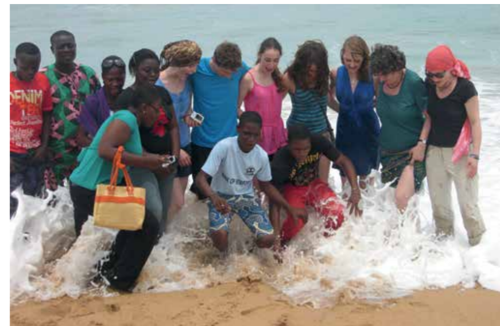
Gemeinsam Spaß haben: Schüler der Elfenbeinküste mit deutschen Schülern am Meer.

zentrale Rolle. Wer in der Zukunft diese Kompetenzen nicht hat, wird als „Analfabet“ gelten. Die Schulpartnerschaft bietet einen Rahmen, in dem das Globale Lernen stattfindet. Die Begegnung mit der fremden Kultur ist bereichernd, die Schüler lernen, Dinge aus der Perspektive des Anderen zu betrachten und über den Tellerrand zu schauen. Klar kann es vorkommen, dass der Partner des Nordens seinem Partner des Südens finanziell beisteht. Aber glauben Sie mir, die Partner des Südens freuen sich nicht immer über diese Situation. In Afrika weiß man ganz genau, dass eine Schulpartnerschaft auf gleicher Augenhöhe kaum möglich ist, wenn einer der Partner auf die finanzielle Unterstützung des anderen angewiesen ist. Zum Thema ▶