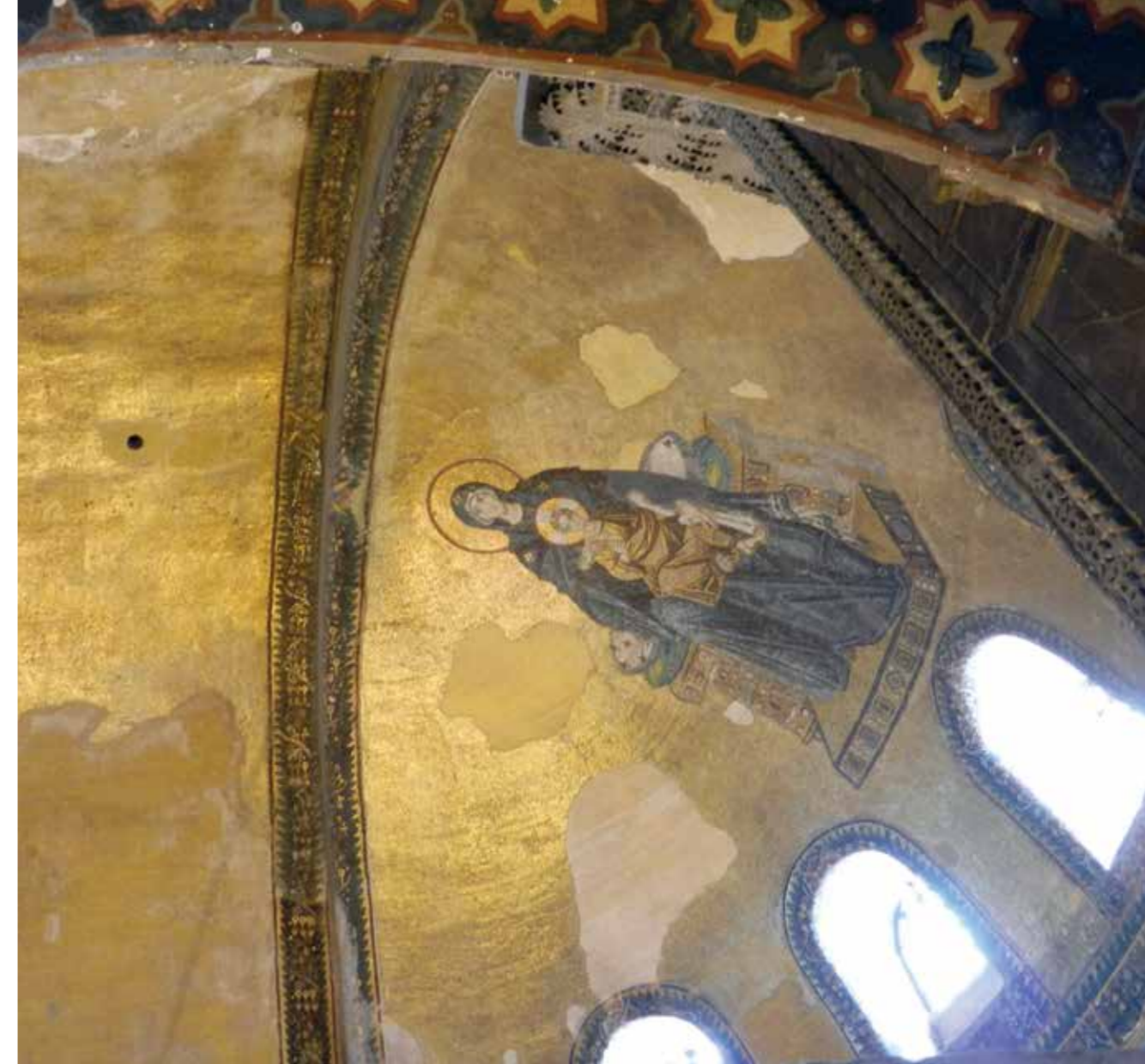
Mission steht heute nicht für Überwältigung, sondern für Kommunikation.

Mission heute, das steht für Kommunikation, nicht für Überwältigung. Darum geht es bei kirchlichen Direktpartnerschaften vor allem um Begegnungen, zu denen gegenseitig eingeladen wird. Der gemeinsame christliche Glaube ermöglicht dabei ein Fundament des Vertrauens, das durchaus konkret erfahrbar wird und einen überraschenden Kontrast bildet zu touristischen Unterneh-